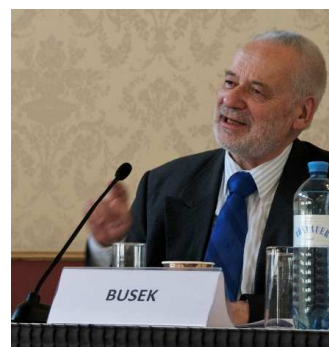
Dr. Erhard Busek (Vortragender)